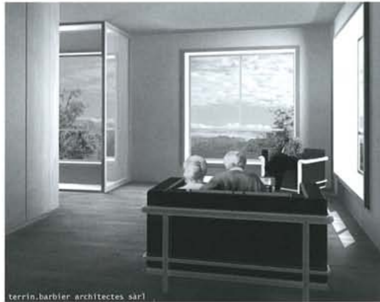
Des appartements lumineux et spacieux.

ont finalement proposé, pour améliorer le sentiment de sécurité et en collaboration avec le maître de l'ouvrage, d'intégrer dans chaque logement des réduits et d'aménager les locaux techniques au rez-de-chaussée. Les appartements, identiques dans leur typologie, sont néanmoins tous originaux de par la disposition de leurs ouvertures extérieures. Les espaces servis (séjour, coin à manger et chambres) de chaque appartement sont délimités par des volumes accueillant les espaces servants (cuisine, salle de bain, réduit, loggia). Des portes coulissantes permettront en outre d'ouvrir ou de privatiser les différentes pièces. Tous les espaces seront bien sûr entièrement accessibles aux chaises roulantes. Afin de créer des liens entre locataires et de minimiser le sentiment d'isolement à l'intérieur des appartements, les cuisines bénéficieront d'une fenêtre donnant sur les circulations intérieures du bâtiment.