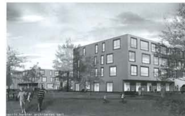
Les deux nouveaux bâtiments, entourés de pelouses et d'arbres.

La portion de terrain sur laquelle doivent s'insérer les logements protégés se situe sur les jardins communaux mis à disposition des habitants de Renens, derrière une