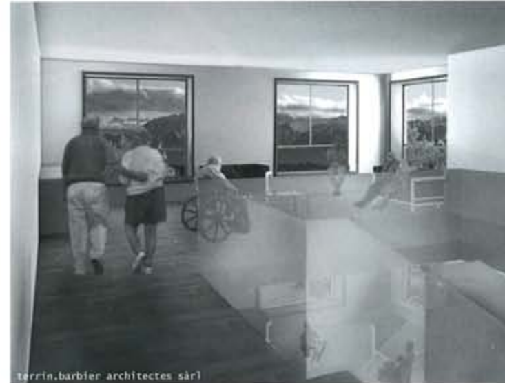
Le salon à l'étage est le lieu de rencontre par excellence.